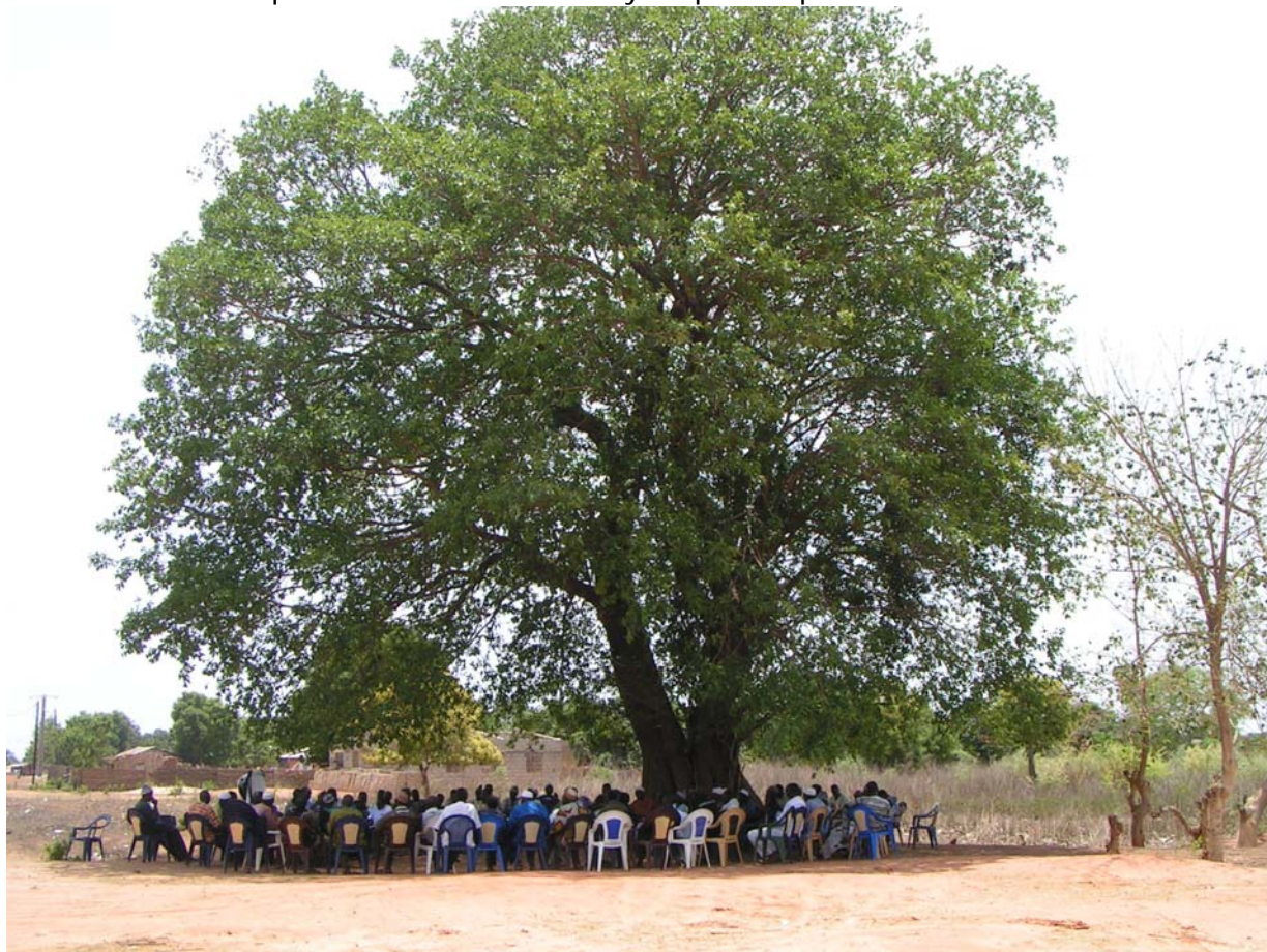
Réunion à Diattacounda, région de Kolda

Les 09 CLPA de Ziguinchor et le CCP de Goudomp : Gages d'une exploitation responsable des ressources halieutiques côtières et outils citoyens pour la prévention des conflits.