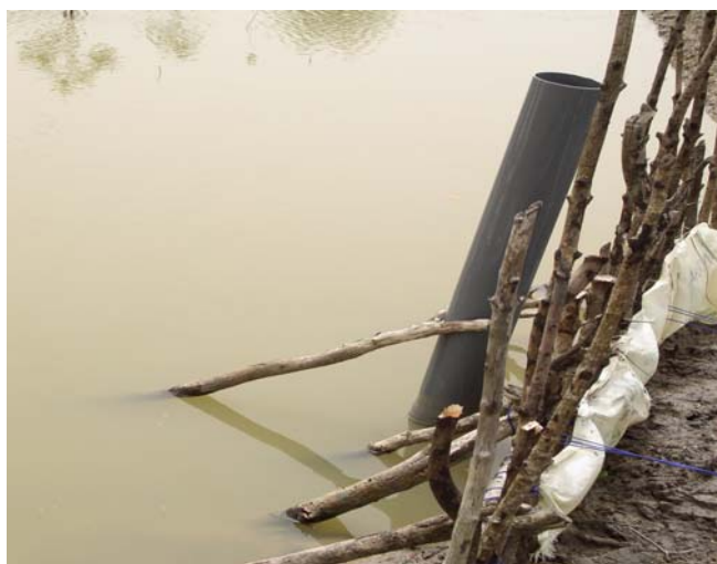
Figure 2 : bassin amélioré

Les images ci dessous montrent des bassins piscicoles en eau avec une entrée d'eau améliorée.