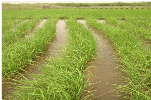
Figure 5 eaux de rizières riches en phytoplancton