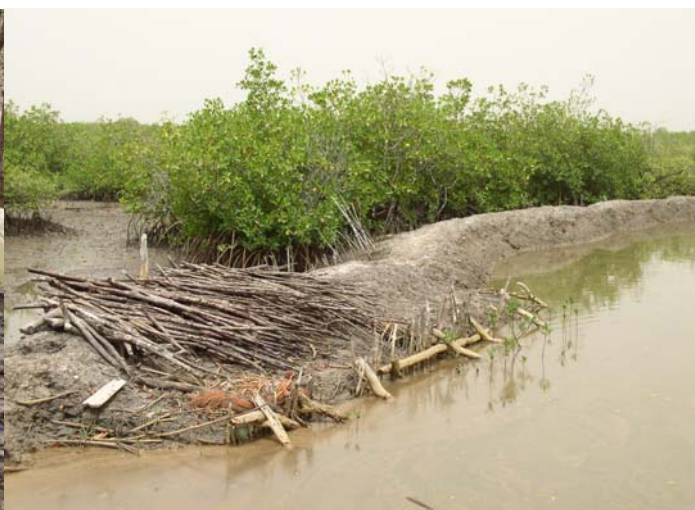
figure 3 : bassin traditionnel