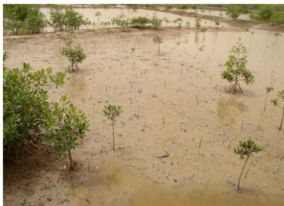
Figure 4 : reboisement dans un bassin piscicole A Kagnout

Les seuls apports exogènes notés sont le son de riz (Bessire, Kartiack, Mlomp et Thionk Essyl) Et des branchages de Cassia tora (figure 5) dans les bassins de Kagnout.