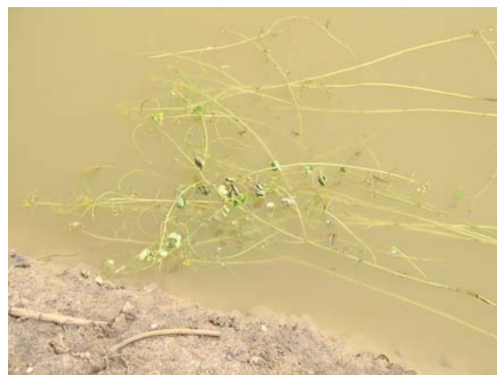
Figure 5 : apport de nourriture à base de branchages dans un bassin piscicole à Kagnout